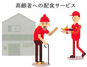
高齢者への配食サービス