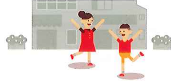
障がい者スポーツ