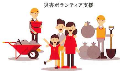
災害ボランティア支援