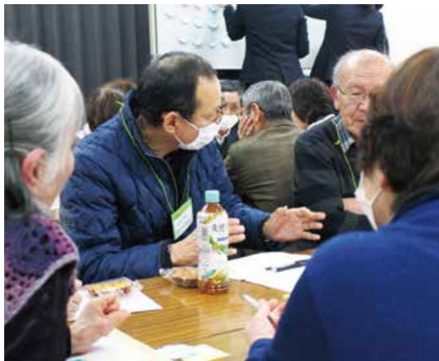
地区で活動する中での気づきやアイデアを話し合う皆さん

にどうやったら参加しやすくなるのか？若い人たちがどう巻き込んでいくのか？などをテーマに、グループで話し合う場面では、どの地区でも共感できることが多く活発に意見が飛び交っていました。参加者からは「行事やイベントの段取りの話し合いはするけど、今回のように一つのテーマについてしっかりと話し合う機会って今まであまりなかったですよ」という声が聞かれ、このようなこれからの地域を考える話し合いの場は、今後ますます大切になってくるのだと感じました。 市社会福祉協議会では引き続き、地区を巡回してミニサミットを開催し、話し合いの場をつくっていききたいと考えています。