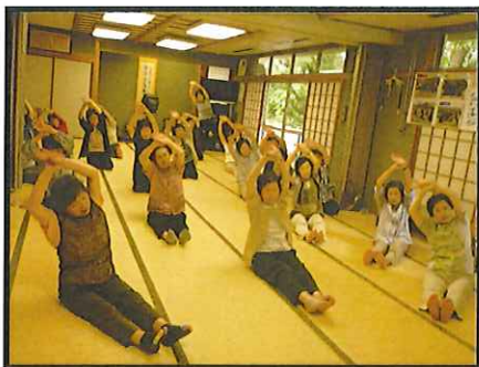
元気はつらつ体操