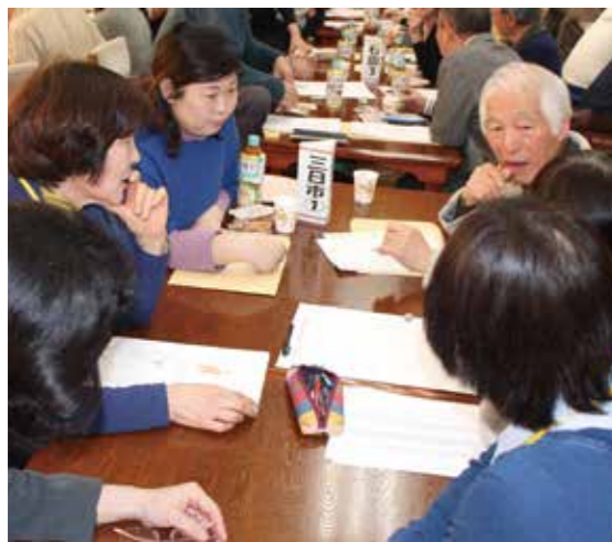
年1回、支援活動で見た地域の課題や気づきを共有し、皆さんの見守りに役立てています