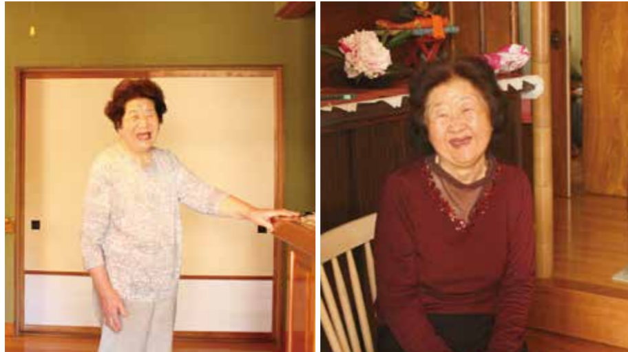
顔なじみとの何気ない会話に笑顔がこぼれます

また、くろベネットでは、多くの地元企業が見守り活動に協力しているのも特徴です。新聞や郵便・荷物の配達、電気、ガスの検針などで自宅に伺った時にポストやメーターの動き、家の様子など何か異変を感じた時には、市社協に連絡をもらって異常を確認する体制をとっています。過去に新聞が数日間たまったままになっているとの連絡を受け、一人暮らしの方の安否確認につながったこともあります。