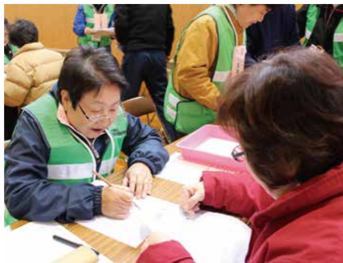
ニーズ受付やマッチングなど役割ごとに班に分かれて行いました

だけではどうにもならないことがあるからこそ、普段から「減災」の意識を持ち、自分で備える、家族で話し合う、地域で考えることから始めることが大切だと話します。