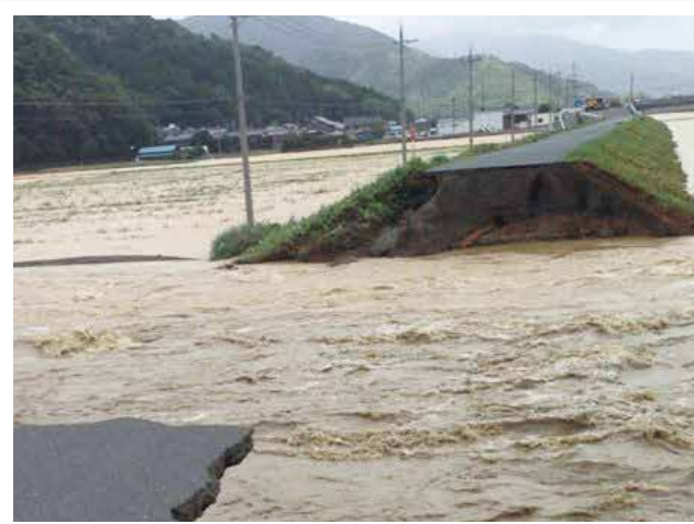
H25 台風18号被害：小浜市(福井県)