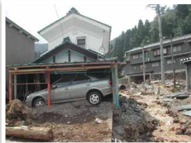
H16 福井豪雨被害：福井市