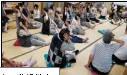
元気はつらつ体操教室

また当館では『元気はつらつ体操教室』『囲碁・将棋クラブ』『元気カラオケクラブ』『ポールウォーキング』などの活動を行っています。どうぞ気軽にお越しください！