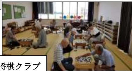
囲碁・将棋クラブ