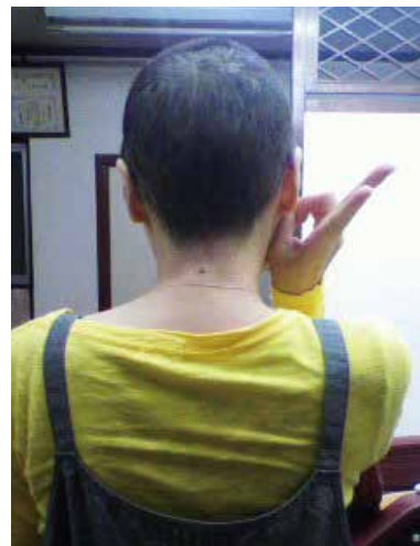
抗がん剤治療と向き合う中で、唯一撮った写真