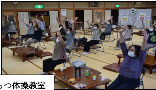
元気はつらつ体操教室

(コロナウイルス感染症対策として、現在『囲碁・将棋クラブ』『元気カラオケ』などの活動は行っておりません。)