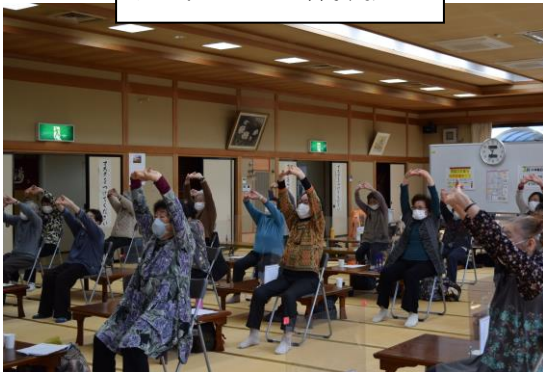
元気はつらつ体操教室