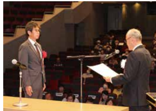
表彰を受ける黒部峡谷鉄道株式会社様

式典では黒部市の福祉活動に貢献された方々や、地域福祉推進のために多額のご寄付を頂いた方々への表彰が行われ、11個人3団体が受賞されました。