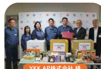
YKK AP株式会社 様