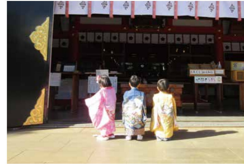
七五三宮参りの子どもたち

設大国と呼ばれる現在の現状があります。その背景の一つには、戦争で家も家族も失った子どもたちを保護するために戦後、各地で施設が広まったことがあります。時代とともに保護を必要とする背景が変わった今、子どもたちの養育の場は施設ではなく家庭的な環境が重要であると、里親制度の推進が期待されています。「子どもの成長に大切なことは、特定の大人との安定した関係を築くことです。その過程で、安心感や自己肯定感を高めることができ、周囲の大人との信頼関係を築いていきます。そし