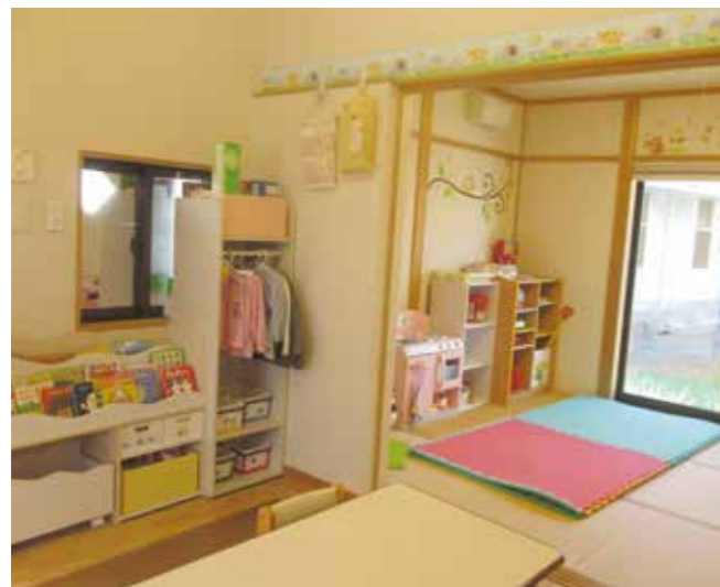
小規模棟の室内には、絵本やおもちゃが並ぶ

のまねをしながら道具の使い方やお手伝いを覚えていきます。しかし、集団生活では時間や活動範囲が限られており、自分の思うように遊べないことがあります。そこで、少しでも家庭的な経験ができるように一般住宅を再現した小規模棟を併設し、2歳以上の子がベアになって一日自由に遊び、おもちゃの片づけや食事、お昼寝、お風呂に入る経験などをしていきます。