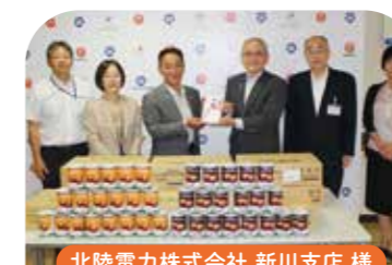
北陸電力株式会社 新川支店 様